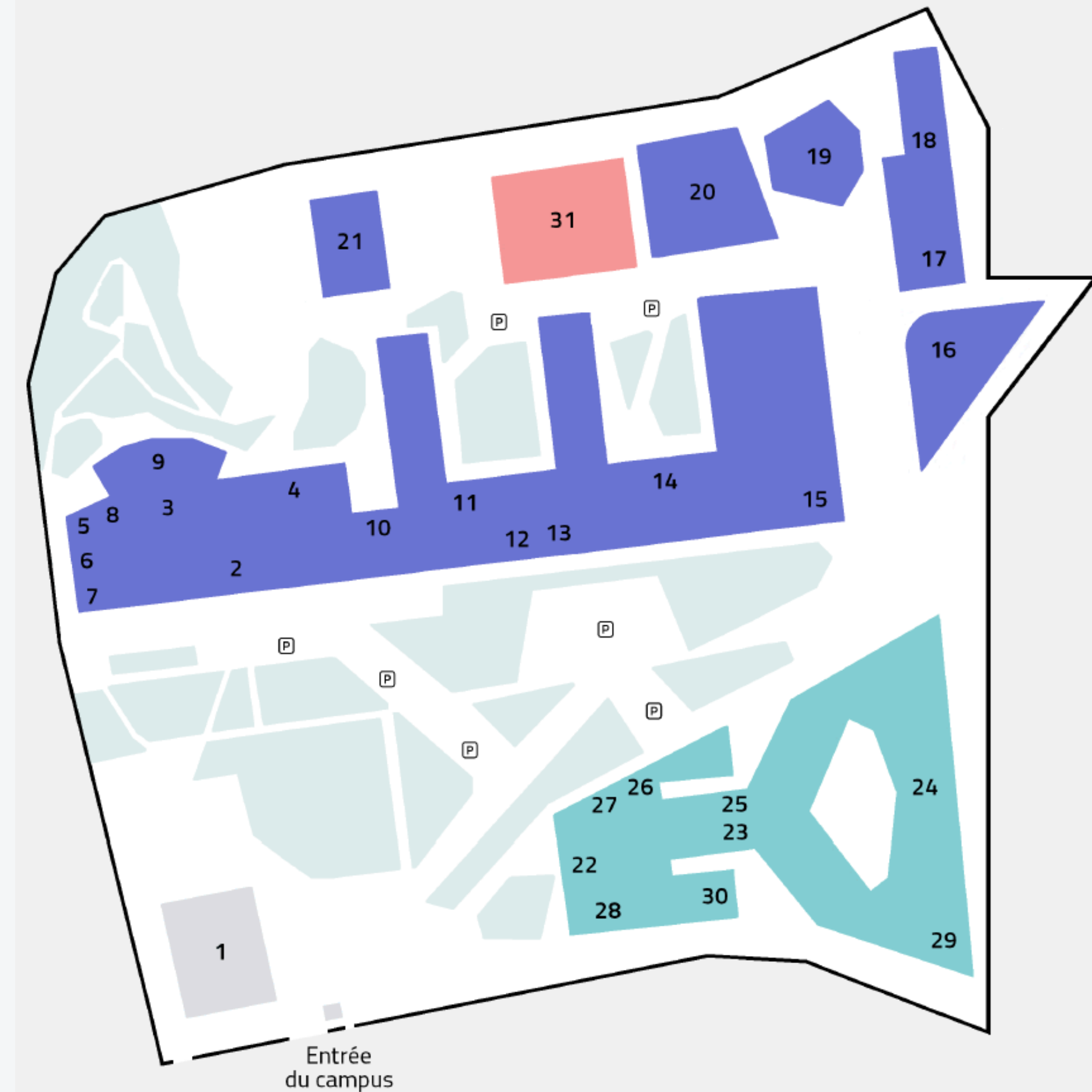
Campus la Timone - Université d'Aix-Marseille

Horaires : du lundi au vendredi : 11h30-13h30 et de 19h à 20h30